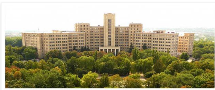
Кафедра економічної кібернетики і прикладної економіки – одна із провідних кафедр Харківського національного університету ім. В.Н.Каразіна

Студенти мають можливість пройти навчання у межах програми прямої мобільності студентів (Mobility Direct) в Університеті Барселони (Іспанія), Університеті м. Лодзь, Політехнічному університеті м. Лодзь (Польща) та інших університетах світу.